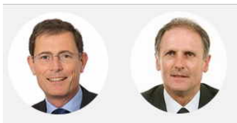
Laurent Lafon Président de la commission, Sénateur du Val-de-Marne ( Union Centriste )

La commission de la culture, de l'éducation et de la communication a émis un avis de sagesse à l'adoption des crédits des programmes 219 consacré au sport et 350 consacré aux équipements olympiques du projet de loi de finances pour 2022.