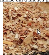
Les chaudières seront alimentées par des plaquettes bois.