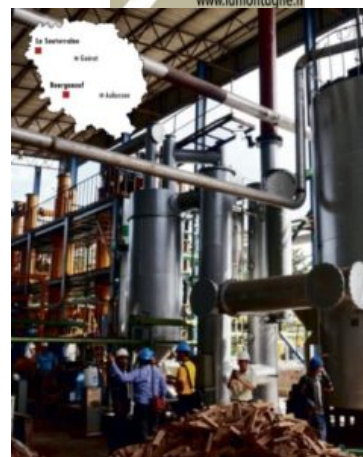
Une technologie chinoise qui a fait ses preuves en Afrique